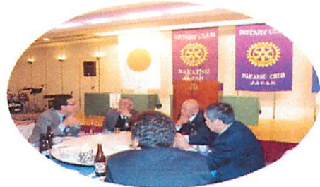
和気あいあいの懇談