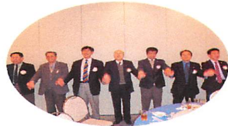
みんなで「手に手つないで」 合 唱