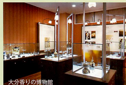
大分香りの博物館