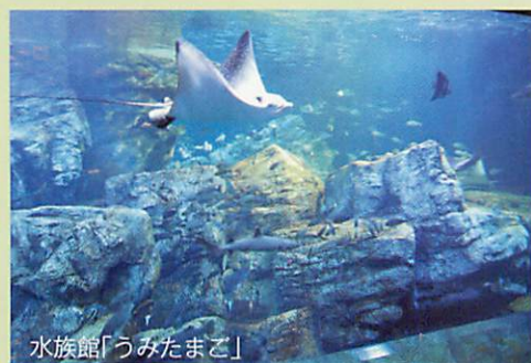
水族館「つみたまご」